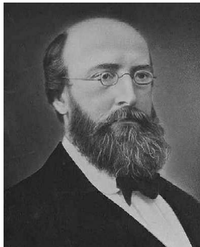
Benjamin A. Gould

Un hecho singular, que marca claramente la influencia de Gould durante los primeros años de la dirección de Thome, se relaciona con el programa internacional francés Carte du Ciel, destinado a registrar fotográficamente todo el cielo (ver capítulos 16 y 19). Ante la