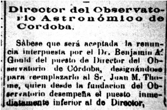
El Eco de Córdoba, 1885

También se desempeñó como vicecónsul de los Estados Unidos en la ciudad, entre 1877 hasta 1906 2 .