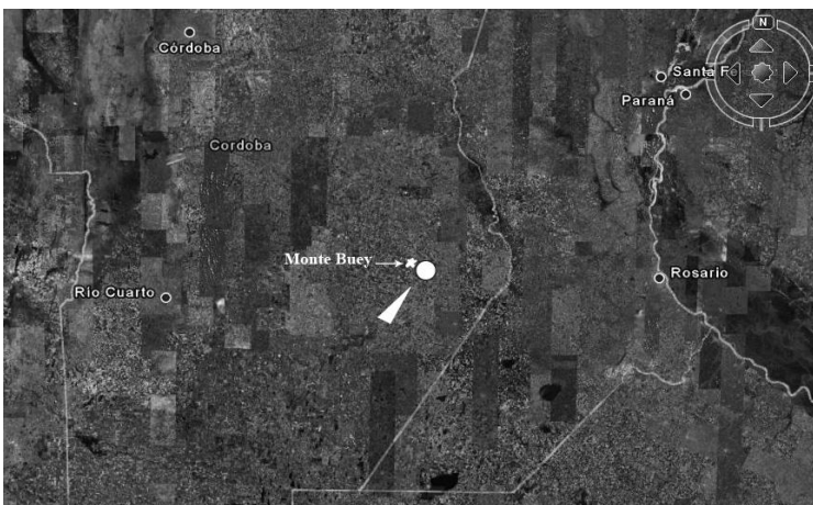
Ubicación de la estancia La Margarita. (Mapa base Google Earth)

Poco después, en 1891, la suerte se dividió en tres partes iguales de unas 3.200 hectáreas, correspondiéndole a Thome la norte, que pasó a llamarse La Margarita en honor a su hija.